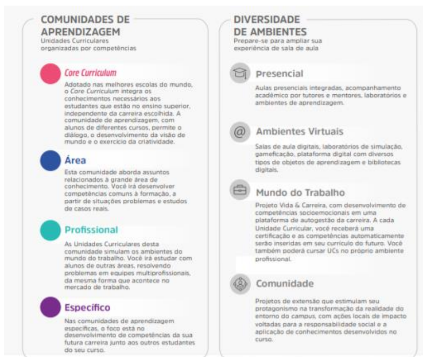
Figura 1 – Comunidades de aprendizagem e diversidade de ambientes

A flexibilidade do Currículo Integrado por Competências permite ao estudante transitar por diferentes comunidades de aprendizagem alinhadas aos seus respectivos eixos de formação. O percurso formativo é flexível, fluído, e ao final de cada unidade curricular o aluno atinge as competências de acordo com as metas de compreensão estudadas e vivenciadas ao longo do semestre.